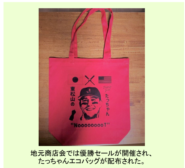
地元商店会では優勝セールが開催され、たっちゃんエコバッグが配布された。