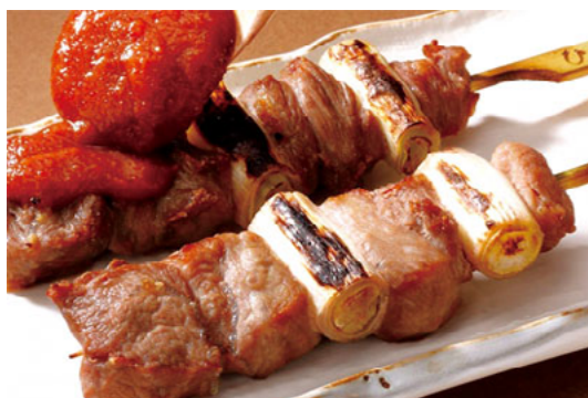
東松山のやきとんは、豚のカシラ肉を炭火で焼いたもの。辛味の効いたみそだれを刷毛で塗って食べる。クセになる美味しさなので機会があればぜひ♪ 約 50 軒のお店で食べることができます。