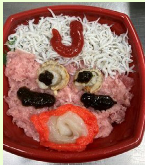
「井丸岡村屋」では、「アイブラック丼」を販売。白いキャップはシラス。「J」ロゴはヌートバー大好物のねり梅、アイブラックは海苔の佃煮、瞳はホタテ、唇は明太子。これは微妙か……（筆者感想）