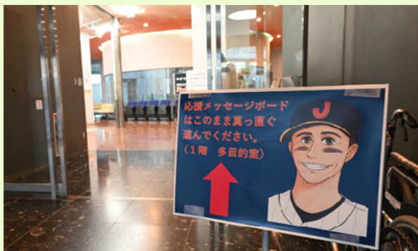
東松山市役所1階ロビーにはメッセージボードが設置された。かわいい応援団♥