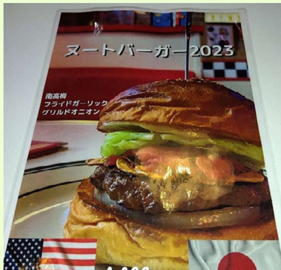
ハンバーガー店「バンダイナー」ではピクルスの代わりに、ヌートバーの好物という梅干しを使った「ヌートバーガー」を販売。