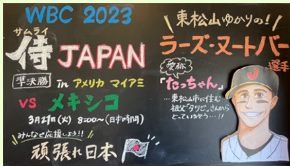
手作りの看板。集まってみんなでたっちゃんを応援！