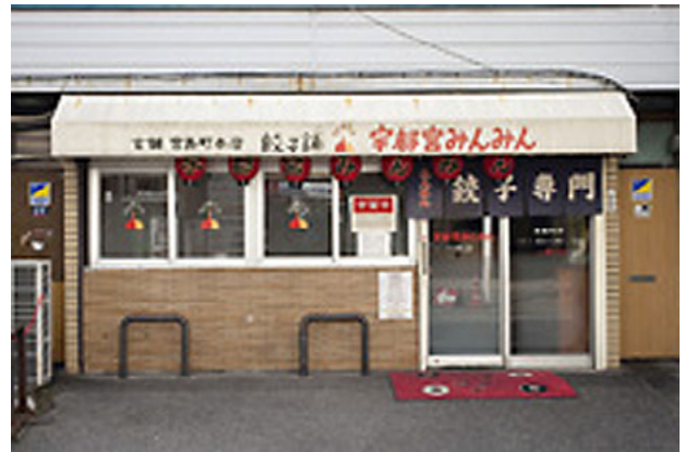
宇都宮みんみん 本店

コロナ禍で気軽に旅行に行くことができない昨今ですが、手軽に現地のグルメを堪能できるのがお取り寄せグルメです。今回のちょっとブレイクでは、全国数多くあるお取り寄せグルメの中から宇都宮出身の筆者が独断で選んだ宇都宮餃子の老舗「宇都宮みんみん」の冷凍餃子をご紹介します。