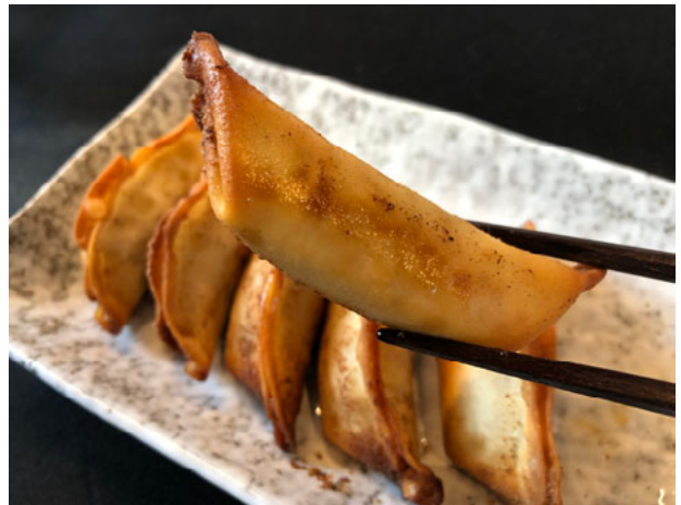
揚げ餃子はおやつにぴったり