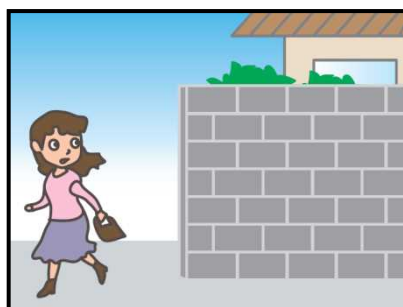
危ない場所から離れて！